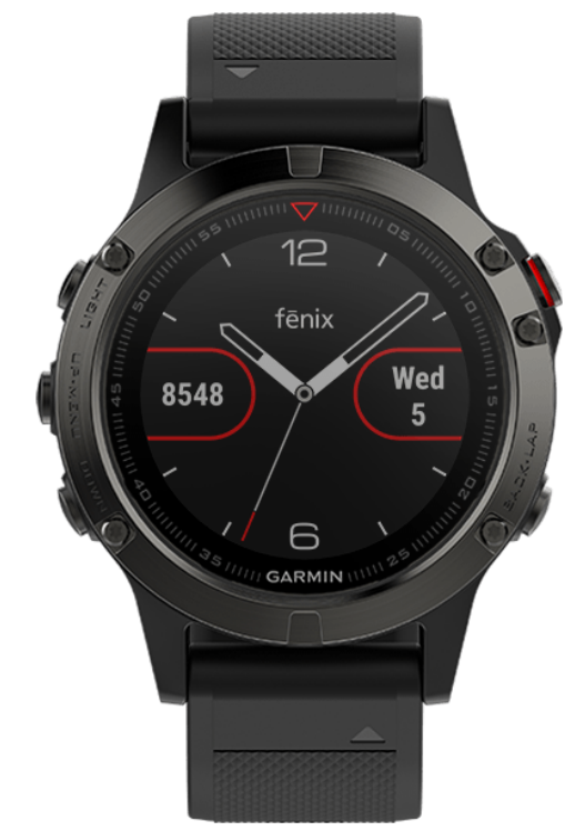
fēnix 5 Oprogramowanie: 19.10.0.0