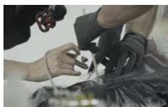
Pobierz zdjęcie 9