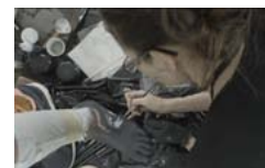
Pobierz zdjęcie 12