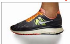
Pobierz zdjęcie 1