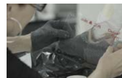
Pobierz zdjęcie 6