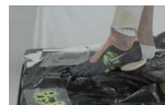
Pobierz zdjęcie 18