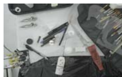
Pobierz zdjęcie 10