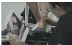
Pobierz zdjęcie 20