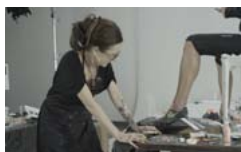
Pobierz zdjęcie 21