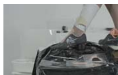
Pobierz zdjęcie 16