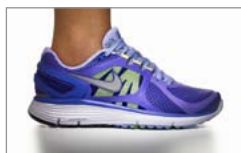
Pobierz zdjęcie 3