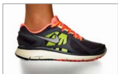
Pobierz zdjęcie 2