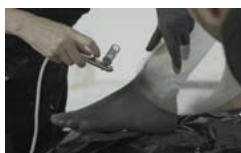
Pobierz zdjęcie 13