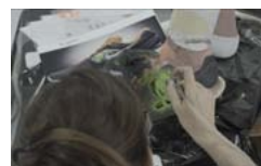
Pobierz zdjęcie 17