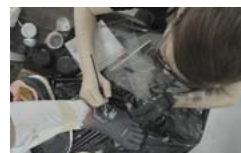
Pobierz zdjęcie 11