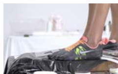
Pobierz zdjęcie 22