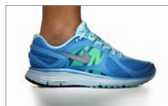
Pobierz zdjęcie 4