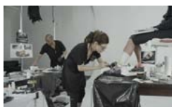
Pobierz zdjęcie 14