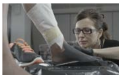
Pobierz zdjęcie 8